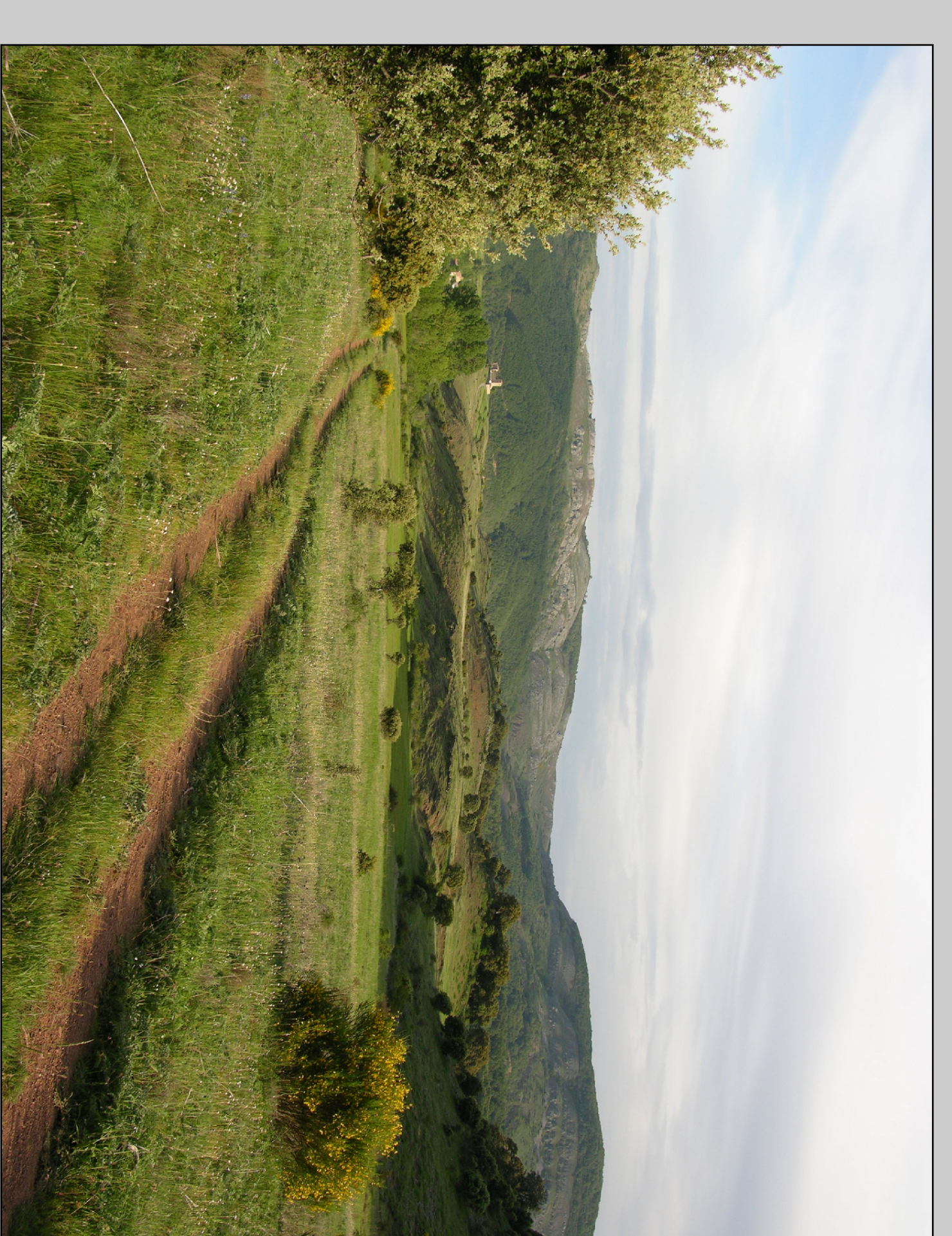
VISTA DEL VALLE DE COLLE.

También es recomendable llevar prismáticos y cámara fotográfica debido a la gran variedad de especies de fauna y flora que podremos contemplar.