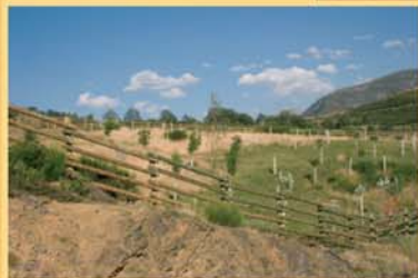
El topónimo del área recreativa de Los Adiles hace referencia a su ubicación en un terreno pendiente e improductivo, que no se araba y que solo servía para pasto.