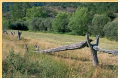
En la vega de Coa aún se conservan los viejos cierres de madera, formados por largas "litas" apoyadas en horcajos, que delimitaban la Cañada Real.