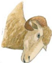
Carnero de raza merina.

Siguiendo el eco de los rebaños trashumantes, atravesamos el pueblo de Pioro por la Calle Real y la Calle de la Trashumancia, que desembocan en el ensanchamiento donde está ubicada la señal de inicio de este itinerario. A partir de este punto utilizamos la pista de tierra que remonta la hermosa vega del Cea, superponiendo su trazado al de la Cañada Montaña de Riaño. Así, casi sin desnivel, la ruta avanza por un fondo de valle no muy amplio, limitado por laderas arbustivas hacia el este y por un extenso rebollar hacia el oeste.