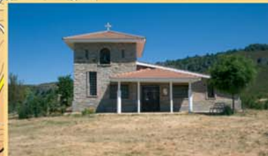
La ermita del Pando es una construcción moderna que sustituye a una antiquísima capilla, que ya debía existir en el siglo X y que estaba ubicada en otro altozano cercano.