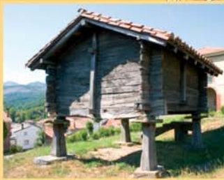
Prioro conserva interesantes muestras de arquitectura popular y un buen número de hórreos de estilo leonés.