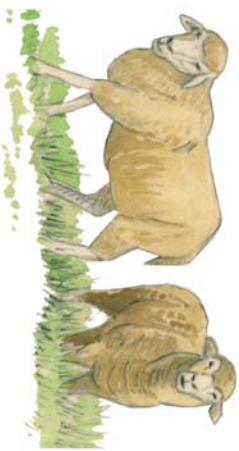
La oveja merina fue siempre una raza muy apreciada por su fina lana y su resistencia física.

Afortunadamente, es un trecho corto, que termina al alcanzar la pista de la ermita del Pando. Recuperado el aliento, la subida prosigue ahora de una forma mucho más relajada por esta pista que conduce a las inmediaciones del santuario. En este lugar, gira bruscamente a la izquierda dirigiendo nuestros pasos hacia la cuerda que separa los municipios de Pioro y Riaño. De este modo, cruzando una ladera de brezo blanco y escobas, sobre la que emergen poderosos bloques de conglomerado y hermosos robles solitarios, se alcanza el collado de Pando Viejo, donde la vista se pierde en contrapuestos horizontes: hacia el norte las quebradas sierras de la Cordillera, y hacia el sur los montes alomados y cada vez menos prominentes que preceden a la Meseta.