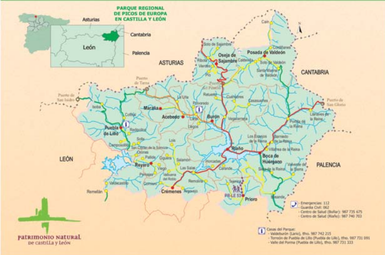
Patrimonio Natural de Castilla y León

Para continuar tendremos que subir unos metros monte a través, hasta encontrar una senda bien marcada al otro lado de un pequeño resalte del terreno. Este sendero nos servirá de guía para ascender por la empinada vaguada que se abre por encima del área recreativa.