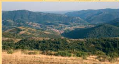
Desde el collado de Pando Viejo se disfruta de una gran panorámica que abarca buena parte del municipio de Prioro.