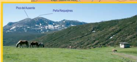
Desde la Vega Los Fornos se disfruta de una buena panorámica hacia el Macizo del Ausente, con la Peña de Requejines (2026 m) situada por delante del Pico del Ausente (2041 m).