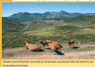
Desde la parte final del recorrido se contempla una buena vista del entorno por el que discurre la ruta.