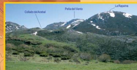
Cerrando el horizonte hacia el este de la pista de Wamba, la rocosa silueta de la Peña del Viento (1992 m) y la mole redondeada de la Rapaina (2019 m) señalan el eje central de la Cordillera