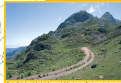
En la Collada del Acebal, la ruta del Camino de Wamba contacta con un itinerario del Parque Natural de Redes, que lleva, en primer término a la braña de Mericueria y, en último lugar, a la Vega de Brañagallones.