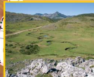
En el paraje de Los Fornos llaman poderosamente la atención los profundos y retorcidos meandros que dibuja un arroyo sobre los sedimentos arcillosos de una llanura cársica.