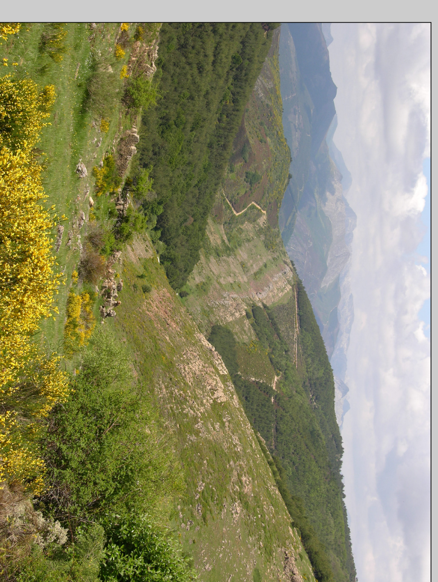
VISTAS DESDE EL COLLADO DE SILLARES

Es aconsejable llevar ropa de abrigo, calzado apropiado, agua y comida además de protector solar.